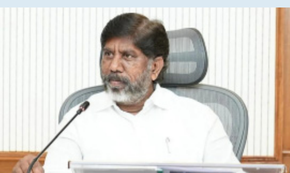
ఎలా ఉంటుందన్న ఆందోళన ప్రభుత్వ వర్గాల్లో వ్యక్తమవుతోందని సమాచారం. ఈ అంశంపై ప్రభుత్వం అధికారిక వివరణ ఇవ్వాలని అవసరం ఉందని విజ్ఞప్తులు సూచిస్తున్నాయి.

ఆరోపిస్తున్నాయి. రాజకీయ వర్గాల్లో వినిపిస్తున్న చర్చల ప్రకారం, ఖమ్మం జిల్లా తన ఆధిపత్యాన్ని చాటుకునే క్రమంలోనే ఈ నిర్మాణం చేపట్టారని, ముఖ్యంగా పొంగులేటి శ్రీనివాస్ రెడ్డి, తుమ్మల నాగేశ్వరరావులకు ఒక రాజకీయ సందేశం ఇవ్వడానికే ఈ భవనం నిర్మాణమని ప్రచారం సాగుతోంది. అయితే ఈ వ్యాఖ్యలపై అధికారికంగా ఎటువంటి స్పష్టికరణ వెలువడలేదు. ఇదే సమయంలో పెన్షనర్లకు పెండింగ్ బకాయిలు, రిటైర్డ్ ఉద్యోగుల బెనిఫిట్లు, ఫీజు రీయంబర్స్ మెంట్ వంటి అంశాలకు నిధుల కొరత ఉందని ప్రభుత్వం పేర్కొంటున్న నేపథ్యంలో, మంత్రిగారి కోసం ఛార్జ్ వ్యయంతో భవనం నిర్మాణం చేపట్టడంపై ప్రజల్లో ఆసంతృప్తి వ్యక్తమవుతోంది. అలాగే, ఒక మంత్రికి ఇంత ఛార్జ్ స్థాయిలో క్యాంపు కార్యాలయం నిర్మిస్తే, ఇతర మంత్రులు కూడా ఇలాంటి సదుపాయాలు కోరితే పరిస్థితి