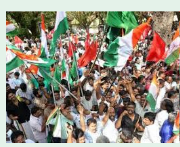
బెంగాల్, తమిళనాడులో ప్రాంతీయ పార్టీలైన టీఎంసీ, డీఎంకేలు గెలిస్తే, ఇండియా కూటమిలో కాంగ్రెస్ ప్రాధాన్యత తగ్గి, మమతా బెనర్జీ, స్టాలిన్ వంటి నేతలు జాతీయ నాయకత్వం వైపు మొగ్గు చూపే అవకాశం ఉంది. 2029 లోకసభ ఎన్నికలకు ముందు ఈ ఐదు రాష్ట్రాల ఫలితాలు దేశ రాజకీయ గమనాన్ని మార్చునున్నాయి.

ఎంపీగా ఉండటంతో గెలుపు సాధించడం ప్రతిష్టాత్మకంగా మారింది. అసోంలో ముఖ్యమంత్రి హిమంత్ బిశ్మ శర్మ తిరుగులేని నాయకుడిగా ఎదిగారు. అభివృద్ధి, హిందుత్వ నినాదాలతో బీజేపీ మూడోసారి అధికారంపై కన్నేసింది. కాంగ్రెస్ పార్టీ ఇక్కడ అంతర్గత కుమ్ములాటలతో ఇబ్బంది పడుతోంది. పైగా కీలక నేతలు బీజేపీలో చేరడం ఆ పార్టీకి పెద్ద దెబ్బ. ఏబయూడిఎఫ్ వంటి పార్టీలతో పొత్తులు కుదిరితేనే కాంగ్రెస్ ఇక్కడ గట్టి పోటీ ఇచ్చే అవకాశం ఉంది, లేదంటే బీజేపీకి మార్గం సుగమం అవుతుంది. పుదుచ్చేరిలో ఎన్. రంగస్వామి నేతృత్వంలోని ఏబిఎన్ఆర్సీ, బీజేపీ కూటమి అధికారాన్ని నిలబెట్టుకోవాలని చూస్తోంది. గతంలో ఇక్కడ కాంగ్రెస్ బలంగా ఉండేది, కానీ నేతల వలనలు ఆ పార్టీని బలహీనపరిచాయి. ఇక్కడ కూడా డీఎంకే మద్దతుతోనే కాంగ్రెస్ తన ఉనికిని చాటుకోవాల్సిన పరిస్థితి ఉంది. చిన్న రాష్ట్రం అయినప్పటికీ, ఇక్కడ గెలుపు కేంద్రంలోని అధికార పార్టీకి ప్రతిష్టాత్మకం. ఈ ఎన్నికలు కాంగ్రెస్ పార్టీకి అత్యంత కీలకం. కేరళలో అధికారం దక్కించుకోలేకపోతే, ఆ పార్టీ కేవలం కొన్ని చిన్న రాష్ట్రాలకే పరిమితమయ్యే ప్రమాదం ఉంది. మరోవైపు,