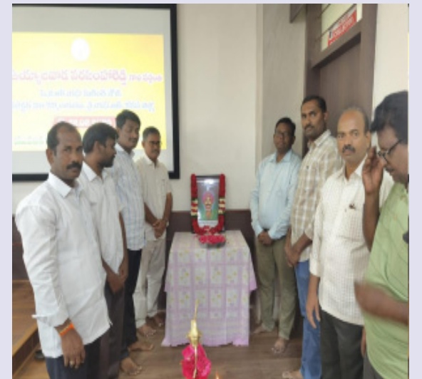
అంటే 1947 ఆగష్టు 15 వ తేదీన మన దేశానికి స్వాతంత్ర్యం లభించింది.

నేటి యువతరానికి ఆదర్శ మూర్తి, ప్రాతః స్మరణీయుడు అయిన ఉయ్యాలవాడ నరసింహారెడ్డి 24-11-1806లో ఆంధ్ర ప్రదేశ్ లోని కర్నూలు జిల్లా ఉయ్యాలవాడ మండలం, రూపనగుడి గ్రామంలో జన్మించారు. ఉయ్యాలవాడ నరసింహారెడ్డి 1847 ఫిబ్రవరి 22న బ్రిటిష్ పాలనకు వ్యతిరేకంగా పోరాడి, వీరమరణం పొందిన స్వాతంత్ర్య సమరయోధుడు. ఆయన కర్నూలు జిల్లాలోని ఉయ్యాలవాడ గ్రామానికి పాలెగాడు. నరసింహారెడ్డి తనకు రావలసిన భరణాన్ని ఇవ్వకపోవడంతో బ్రిటిష్ ప్రభుత్వంపై తిరుగుబాటు చేసి, అనేక పోరాటాలు చేశాడు. 1846 అక్టోబర్ 6న బ్రిటిష్ సైన్యం ఆయనను పట్టుకుని, 1847 ఫిబ్రవరి 22న ఉరి తీశారు. నరసింహారెడ్డి మరణానంతరం 100 సంవత్సరాలకు